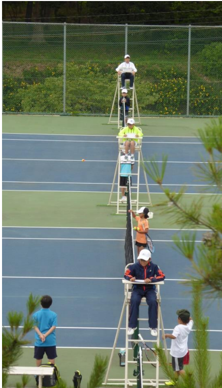
先輩たちがアンパイアをつとめた