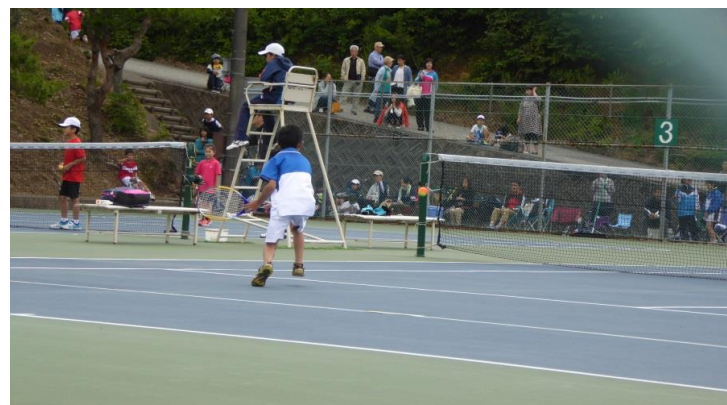
オレンジボール(ハード3面)