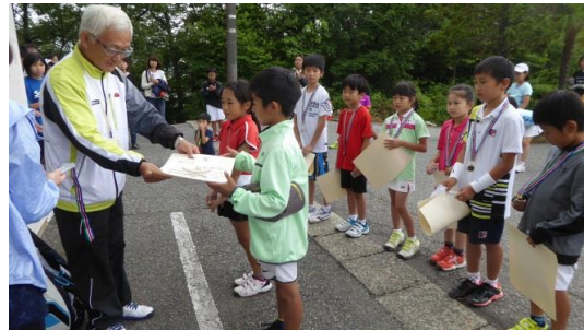
表彰式(メダルと賞状)