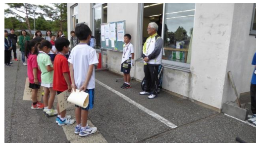
チャンピオンスピーチ