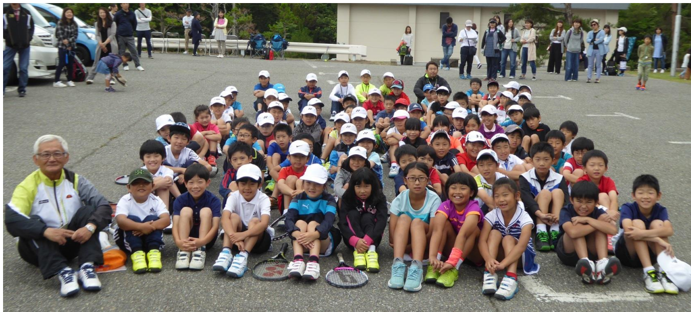
2018. 6. 16 小松市木場潟研修センターテニスコート