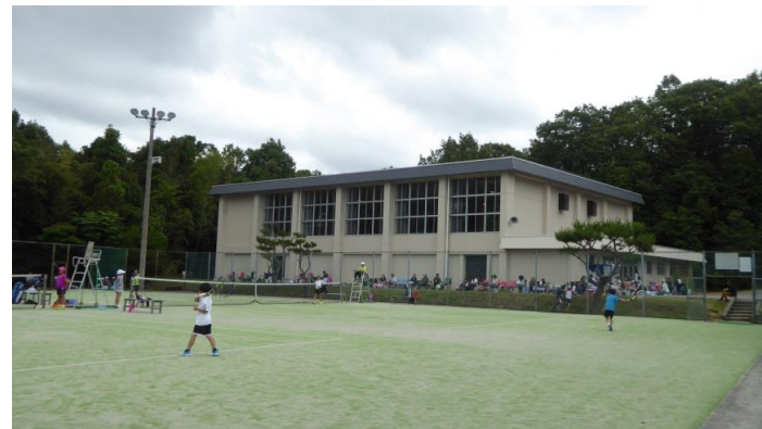
グリーンボール(人工芝4面)