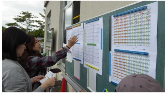
お母さんたちが運営のお手伝い