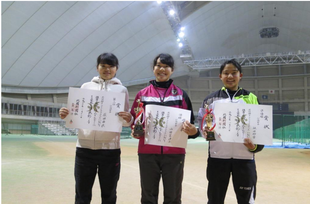
2015. 1. 10 U18女子