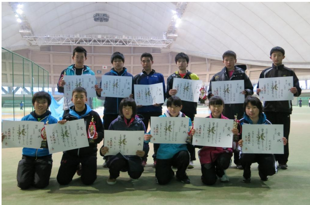
2015. 1. 12 U16U18男子 U16女子